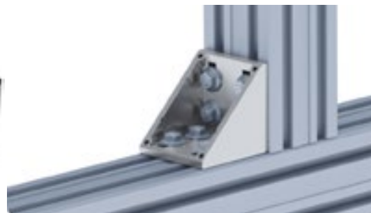
Aluwinkel 80 Alu Connection Angle 80